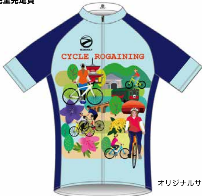
オリジナルサイクリングジャージ