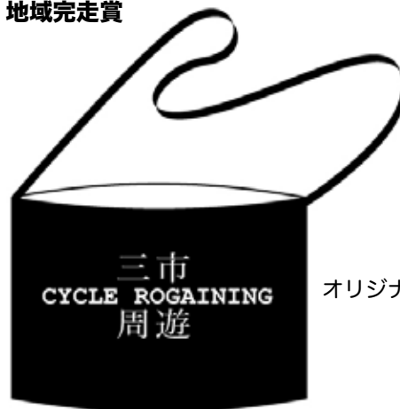
オリジナルサコッシュ